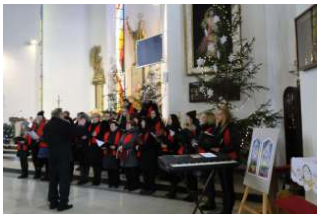
Chór „Lira” z Jabłonowa Pomorskiego gościł w naszym kościele z koncertem kolęd, w niedzielę 10 stycznia.

21,22.01.2016 – Dzień Babci, Dzień Dziadka